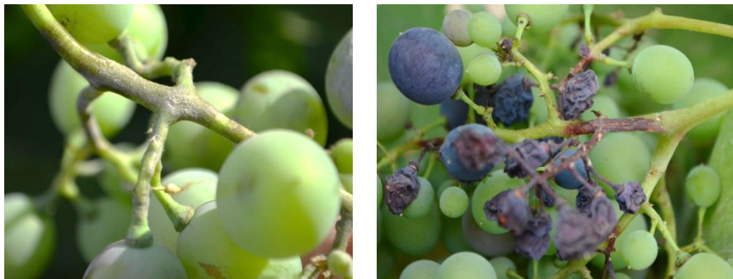
Рис. 1 Развитие оидиума на гребнях гроздей винограда Fig. 1 – Oidium development on the grape stalks

в предыдущие годы пик развития болезни приходился на период с середины июня до середины июля, то в последние годы закрепляется тенденция наибольшей интенсивности развития в период до первой декады и даже середины августа (в зависимости от срока созревания сорта). Гриб развивается не только на зеленых ягодах, но и активно на гребнях и гребненожках в период формирования грозди, захватывая начало созревания, что повышает риск усыхания гроздей и ведет к большим потерям урожая (рис. 1).