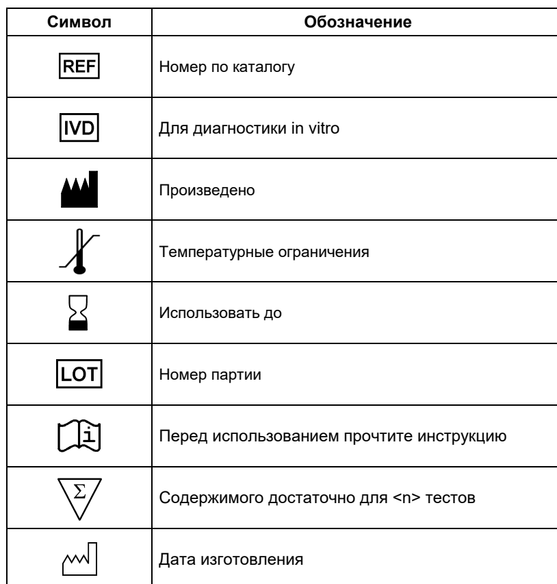
ТАБЛИЦА СИМВОЛОВ И ОБОЗНАЧЕНИЙ