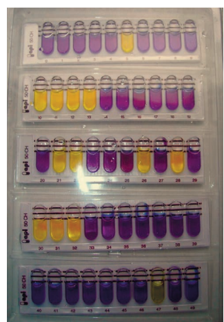
Рис. 3. Leuconostoc