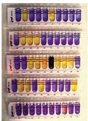
Рис. 2. Carnobacterium

Таким образом, при контроле охлажденного мясного сырья длительного срока хранения необходимо обращать особое внимание на санитарно-гигиенические аспекты производства качественной и безопасной продукции. →