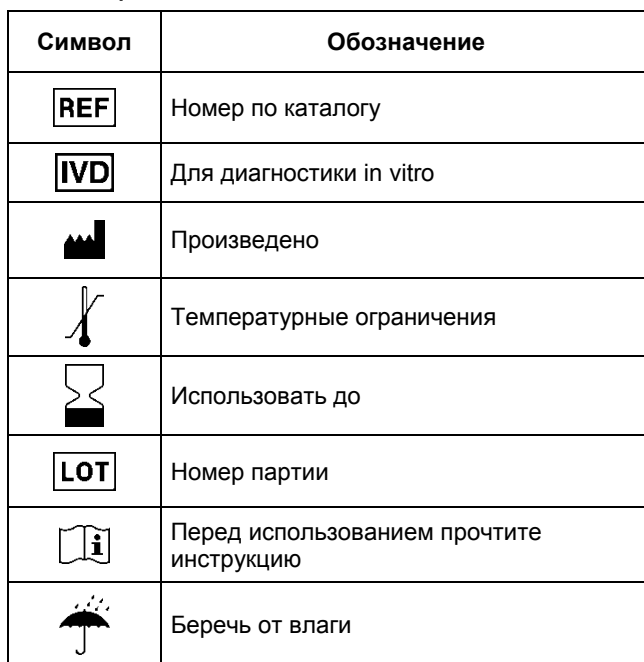
ТАБЛИЦА СИМВОЛОВ И ОБОЗНАЧЕНИЙ