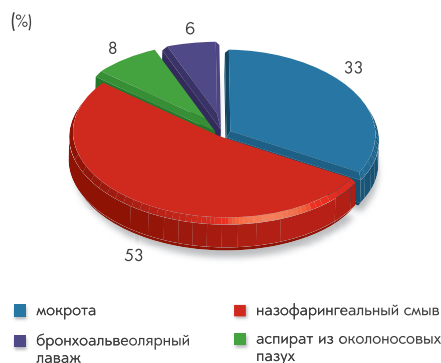
Рисунок 1. Распределение штаммов по типу клинического материала

Результаты определения чувствительности S. pneumoniae к АМП представлены на Рисунке 2.