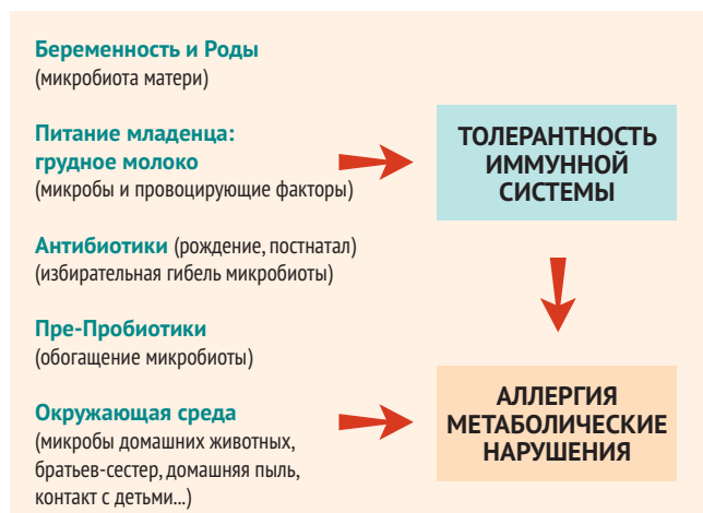
● Рисунок 3. Гипотеза «микробной депривации»

Основной принцип назначения пробиотика – таргетность, т.е. попадание в цель. Назначая пробиотик на длительный срок, необходимо точно знать, что он оказывает эффект в лечении конкретного заболевания. Недобросовестные производители покупают штаммы и